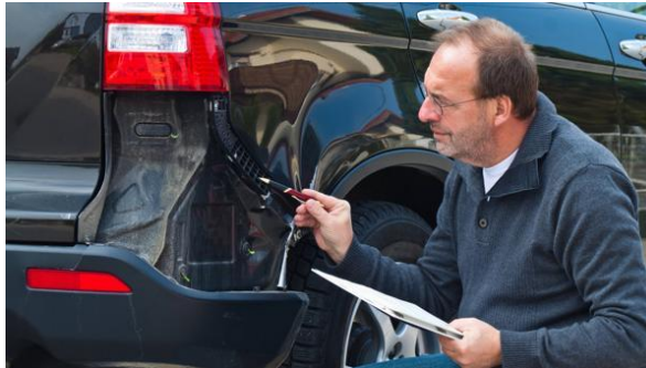
Wer haftet, wenn es auf der Probefahrt zum Unfall kommt?

Kommt es ausgerechnet bei einer Probefahrt zum Unfall, wird bei der Haftung zwischen privatem und gewerblichem Autokauf unterschieden. Was ist dabei zu beachten?